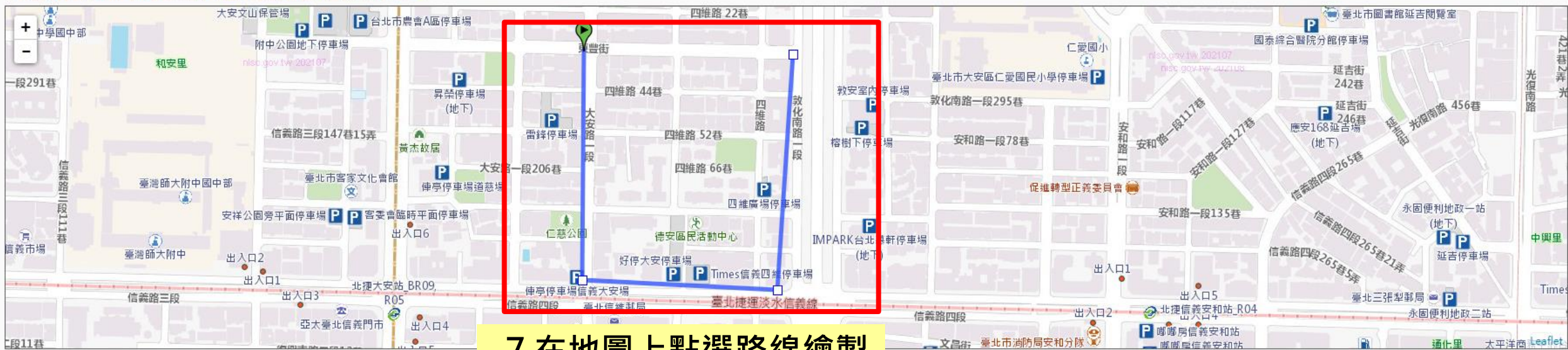
7. 在地圖上點選路線繪製