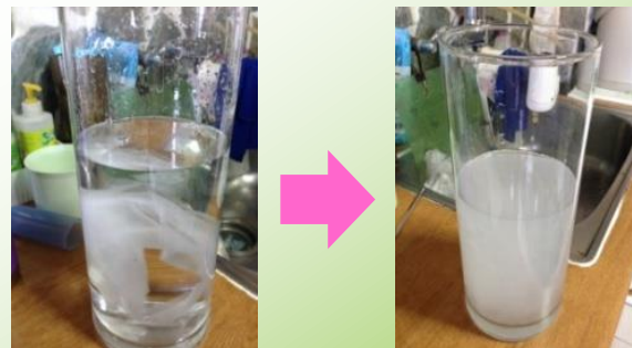
衛生紙於水中狀態

研究顯示，衛生紙投入馬桶增加之固形物沈澱量，對建築物污水處理設施（化糞池）或公共下水道初沉設施有效容積之影響試驗，顯示 投入衛生紙至馬桶不但不會造成堵塞，而且經沖水後已發生破碎 ；但誤用面紙取代衛生紙投入馬桶時， 不但不易破碎發生，而且也因此容易造成馬桶堵塞 （無論是否與污物一併投入馬桶），其主要原因係因面紙中添加了 濕強成分 ，不易分散破碎。