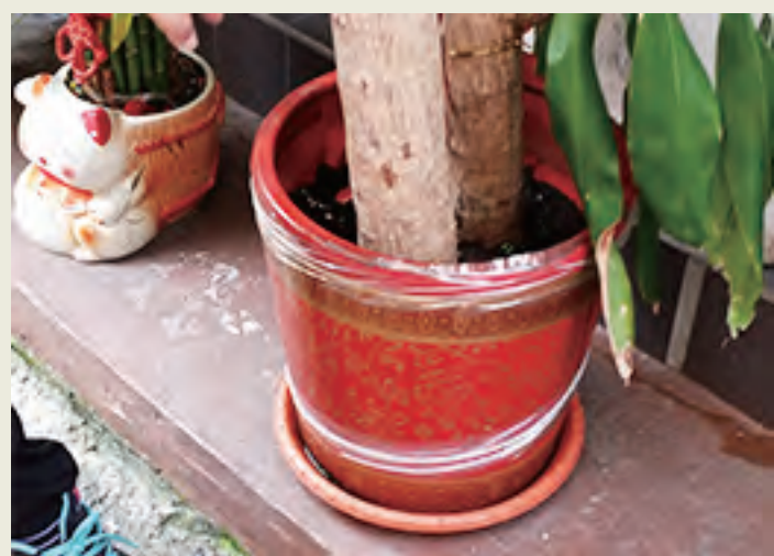
盆栽底盤及各式積水 容器要經常清洗