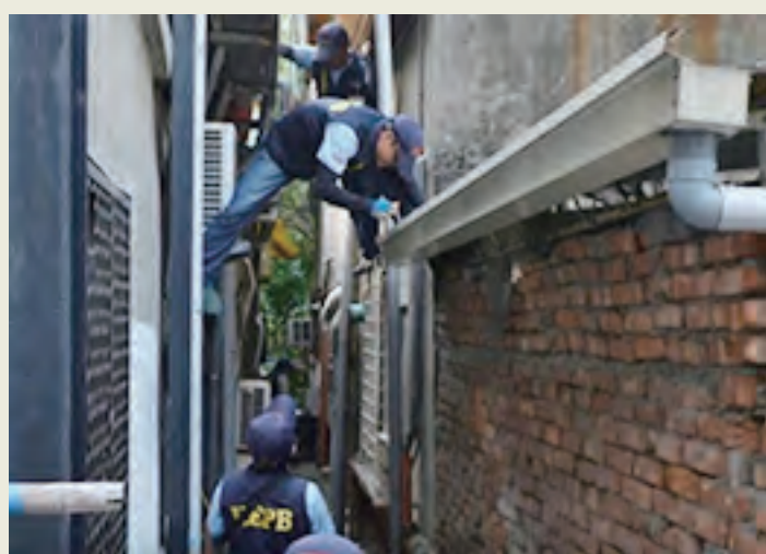
天溝、屋後溝、屋頂排水槽 每週清理不阻塞