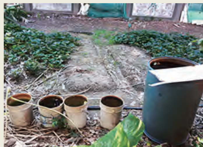
菜園、花園儲水桶要加蓋， 不使用的桶子倒置晾乾